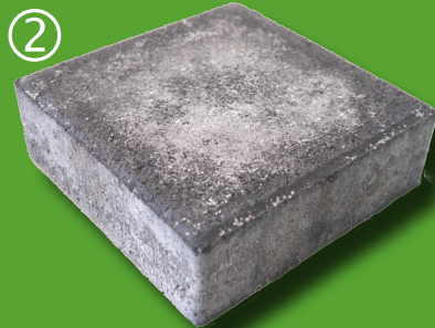
Ausblühungen nach z.B. 3-9 Monaten