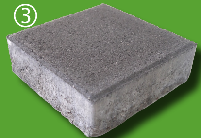
Nach Abwitterung der Kalkausblühungen